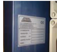
Placa de características y marcado CE