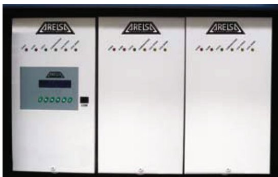
Regulador electrónico trifásico