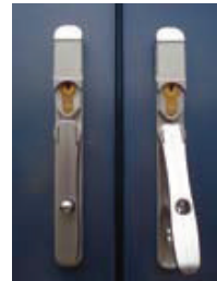
Manetas de seguridad