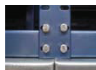
Detalles del montaje