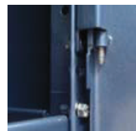
Detalles del montaje